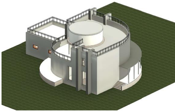
Работа Воробьевой Виолетты

строительства от рождения до смерти, т.е. сноса.