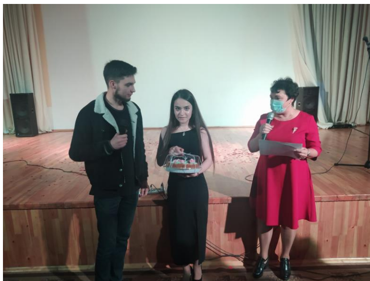
Ежегодный конкурс «Профсоюзная зима» (украшение аудиторий)